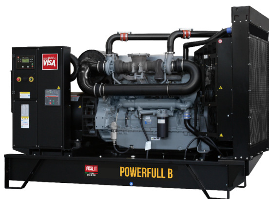
Lediglich zu illustrativen Zwecken