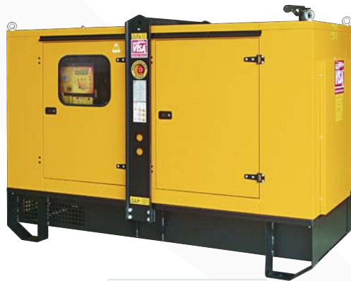
Mod. P 105 GX